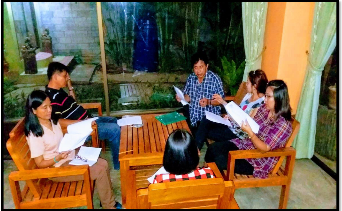
วางแผนการถอดบทเรียน