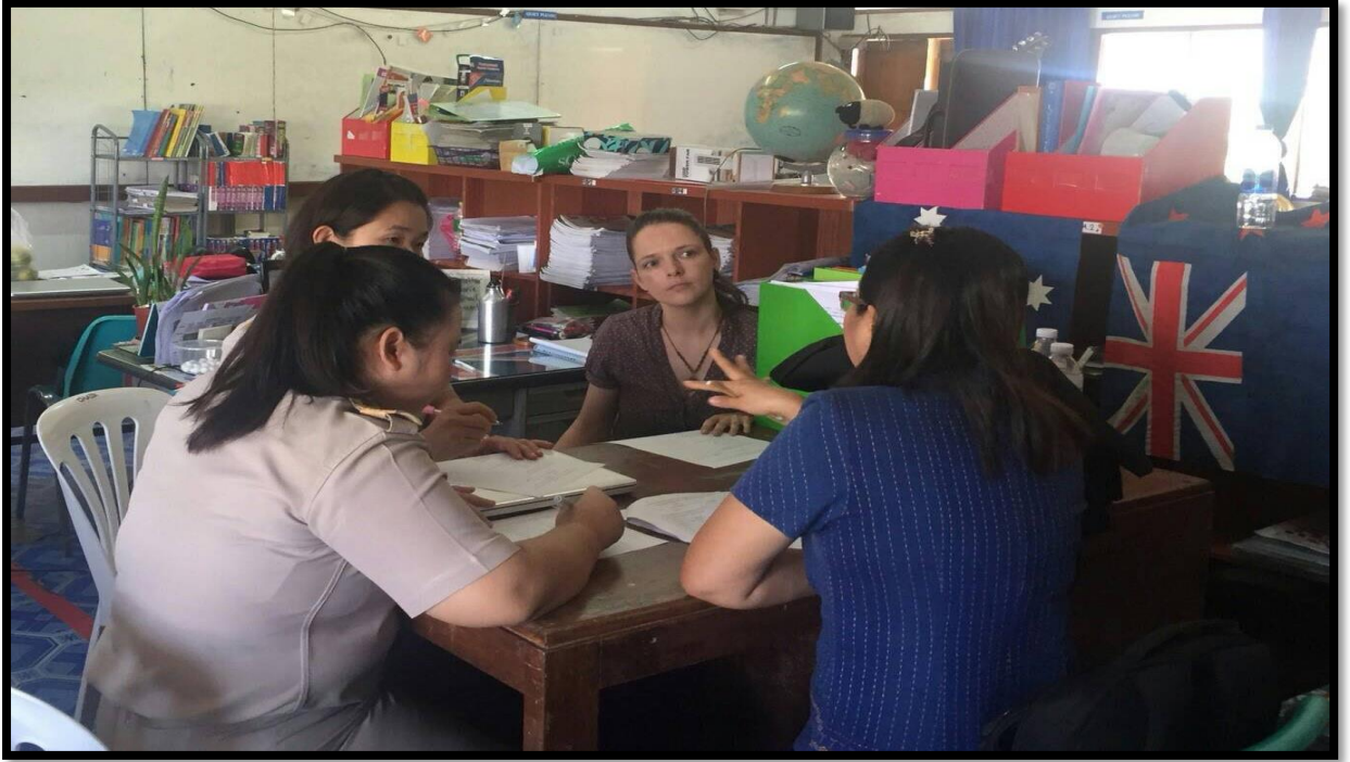
ถอดบทเรียนความสำเร็จของโรงเรียนที่มีค่าพัฒนาที่เป็นแบบอย่าง