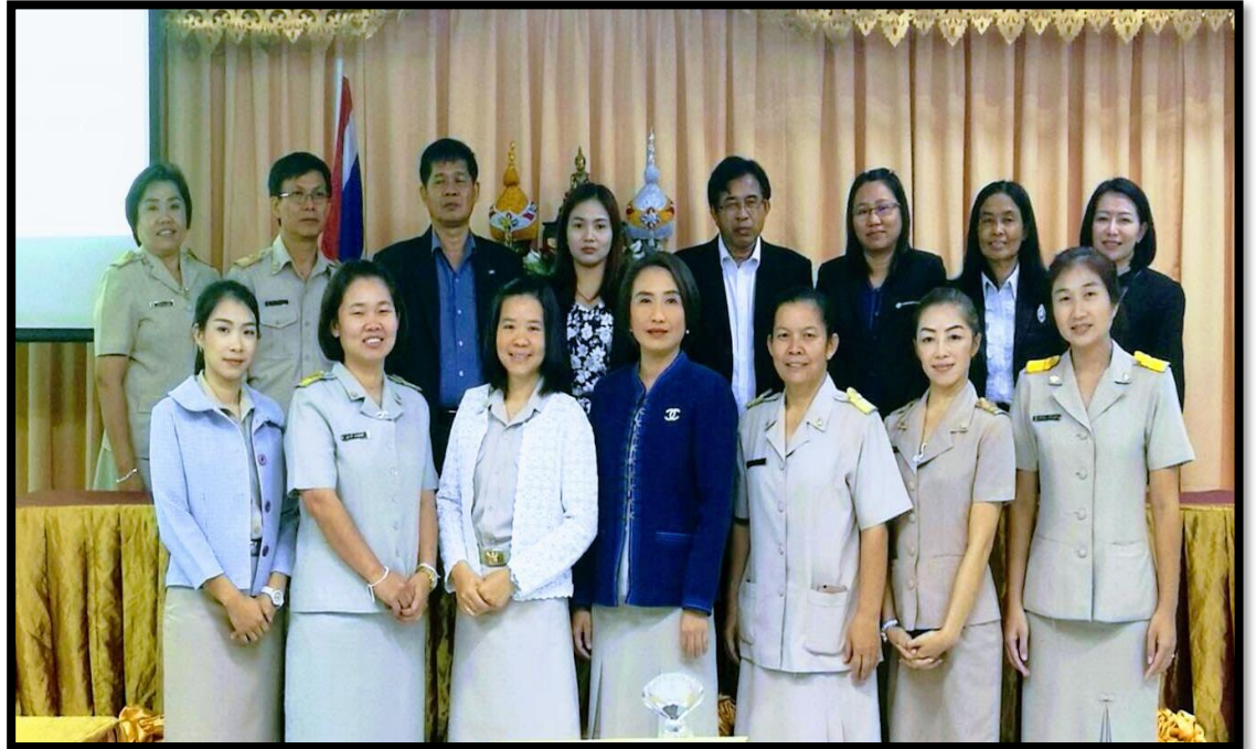
ถอดบทเรียนความสำเร็จของโรงเรียนที่มีค่าพัฒนาที่เป็นแบบอย่าง