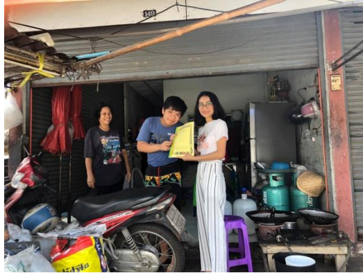
องค์ประกอบที่ 2 cooperation (ร่วมเรียนรู้และปฏิบัติ)