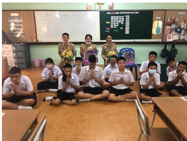
องค์ประกอบที่ 4 co-development (ร่วมคิดค้นวิธีปรับปรุงพัฒนาพายังยืน