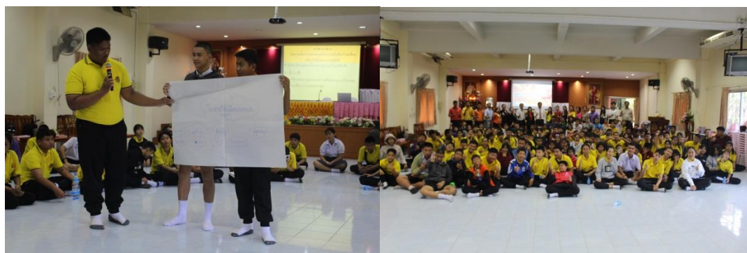
ร่วมวิเคราะห์และวางแผนกับนักเรียนปกติ