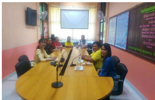
ร่วมวิเคราะห์และวางแผนกับผู้ปกครอง

องค์ประกอบที่ 1 collaboration and co-planning (ร่วมวิเคราะห์และวางแผน)