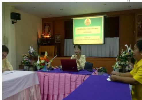
ร่วมวิเคราะห์และวางแผนกับครู