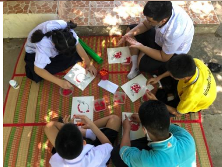
องค์ประกอบที่ 3 co-measure and refection (ร่วมวัดประเมินสะท้อนผล)