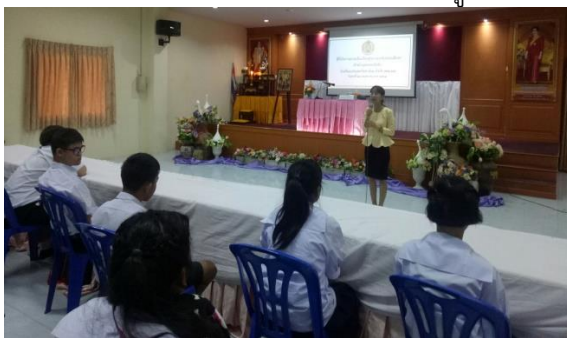
ร่วมวิเคราะห์และวางแผนกับนักเรียนออทิสติก