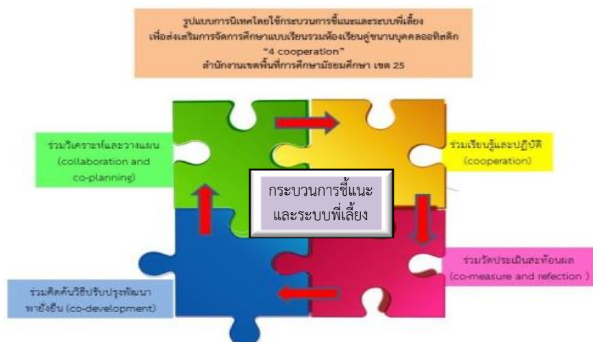
ภาพที่ 2 รูปแบบการนิเทศโดยใช้กระบวนการชี้แนะและระบบพี่เลี้ยง "4 co"

องค์ประกอบที่ 4 : ร่วมคิดค้นวิธีปรับปรุงพัฒนาพียงยืน (co-development) คือ การปรึกษาหารือ ประชุมเพื่อร่วมกันหาวิธีการแก้ไข ปรับปรุง และพัฒนางานให้ดียิ่งขึ้นเกิดความยั่งยืน