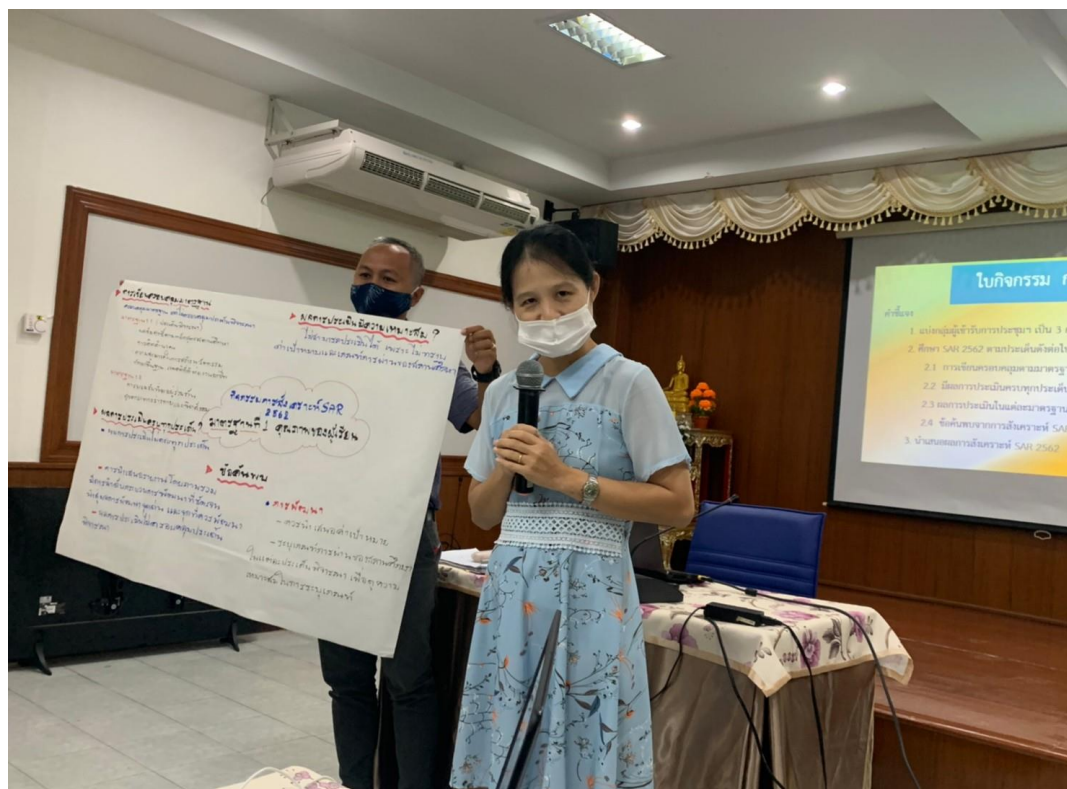
ภาพที่ 9 ครูแกนนำงานประกันคุณภาพการศึกษาของสำนักงานเขตพื้นที่การศึกษาประถมศึกษาลำพูน เขต 1 นำเสนอผลการสังเคราะห์รายงานการประเมินตนเองของสถานศึกษา (SAR) ประจำปีการศึกษา 2562 วันที่ 1 - 2 สิงหาคม 2563 ณ ห้องประชุมบุษราคัม สำนักงานเขตพื้นที่การศึกษาประถมศึกษาลำพูน เขต 1