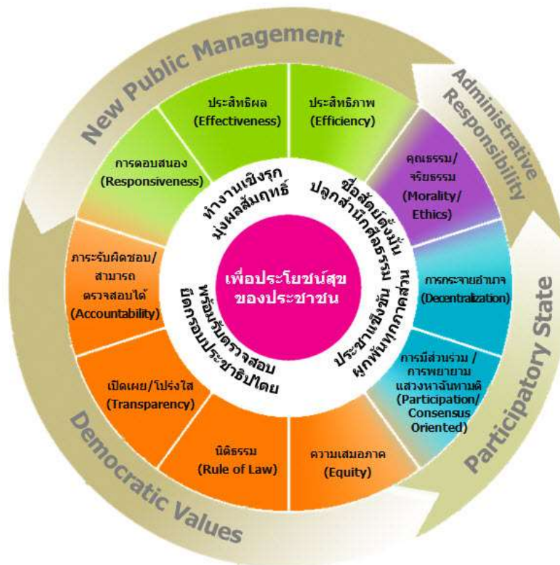
ภาพประกอบที่ 1 แสดงหลักธรรมาภิบาลของการบริหารกิจการบ้านเมืองที่ดี (GG Framework)

สำคัญ และ 10 หลักการย่อยดังกล่าวข้างต้นและโดยที่ในบริบทของประเทศไทยอาจไม่สามารถใช้แนวทางนั้นตามติดกับทุกเรื่องได้ จึงเป็นควรรวมหลักนี้ไว้กับหลักการมีส่วนร่วม และปรับถ้อยคำเป็นหลักการมีส่วนร่วม/การพยายามแสวงหาฉันทามติ (Participation/Consensus Oriented) แสดงหลักธรรมาภิบาลของการบริหารกิจการบ้านเมืองที่ดี (GG Framework) ดังภาพต่อไปนี้