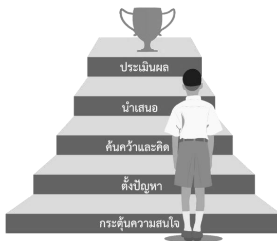
ภาพที่ 2.1 ภาพแสดงขั้นตอนการสอนแบบสร้างสรรค์เป็นฐาน

5.1 รูปแบบการสอนแบบสร้างสรรค์เป็นฐาน (Creativity Based Learning : CBL) เป็นการเรียนรู้ที่ประยุกต์มาจากการสอนโดยใช้ปัญหาเป็นฐาน (Problem Based Learning : PBL) ซึ่งการสอนแบบสร้างสรรค์เป็นฐานนั้น เป็นการสอนที่ยึดผู้เรียนเป็นศูนย์กลาง เน้นการกระตุ้นให้ผู้เรียนเกิดการเรียนรู้ด้วยตนเอง นำไปต่อยอดความรู้เดิมเพื่อสร้างสรรค์แนวทางการเรียนรู้ใหม่ โดยที่ผู้เรียนเป็นผู้คิดวิเคราะห์ สังเคราะห์สร้างแนวทางการเรียนรู้ที่เหมาะสมกับความรู้ความสามารถของตนเอง ทั้งนี้การสอนแบบสร้างสรรค์เป็นฐานจะเกิดประโยชน์ต่อผู้เรียนอย่างสูงสุดได้นั้น ครูควรปรับบทบาทการจัดการเรียนการสอนของตนเอง ให้ผู้เรียนได้พัฒนาทักษะการเรียนรู้โดยทำหน้าที่คอยให้คำแนะนำ ให้คำปรึกษา กระตุ้นให้เกิดการเรียนรู้และปรับสภาพแวดล้อมให้เหมาะสม รูปแบบการสอนแบบสร้างสรรค์เป็นฐานมีรูปแบบ 5 ขั้นตอน 9 บรรยากาศ ดังนี้ (วิริยะ ฤาชัยพาณิชย์, 2558)