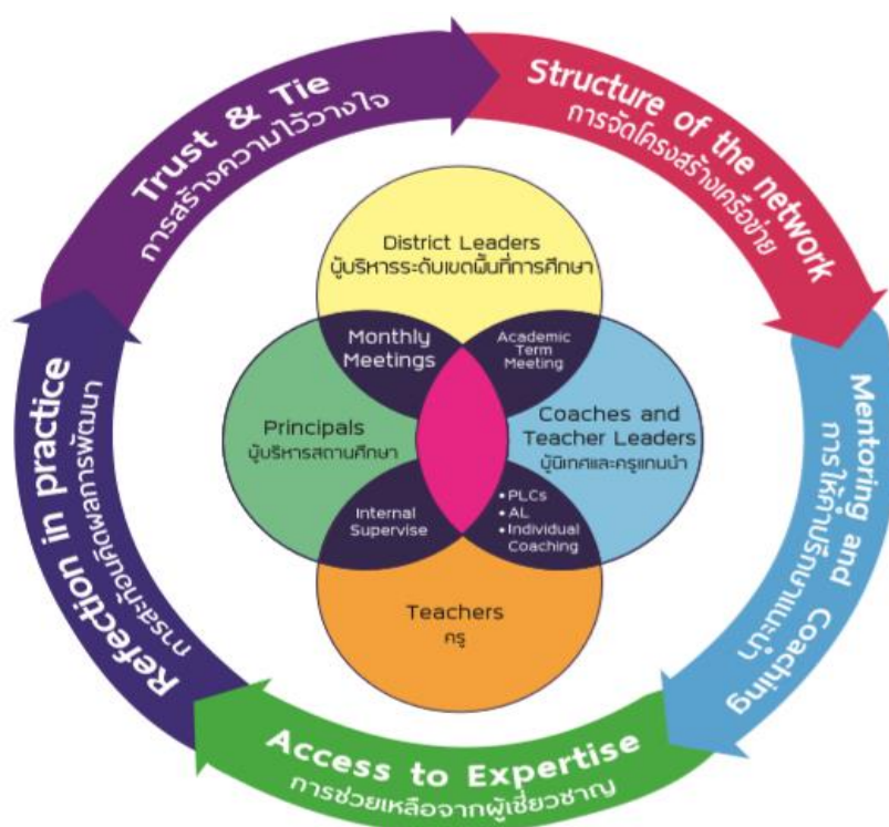
แผนภาพที่ 3 แสดงรูปแบบการนิเทศการจัดการศึกษาเรียนรวมในโรงเรียนเรียนรวม สังกัดสำนักงานเขตพื้นที่การศึกษาประถมศึกษาเชียงราย เขต 1