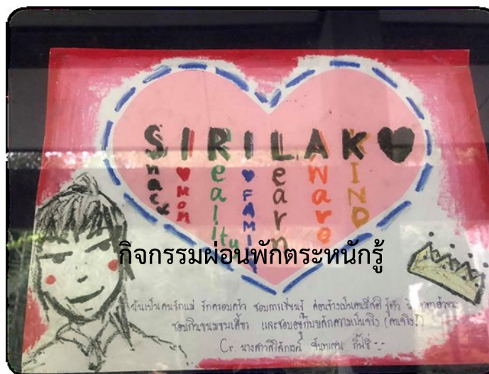
กิจกรรมเพื่อนพักตระหนักรู้